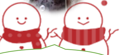
職員手作り雪だるま