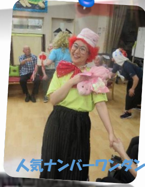
人気ナンバーワンダンサー♡