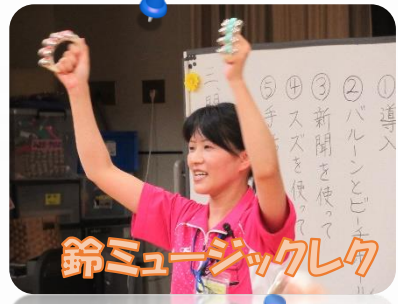
鈴ミュージックレク