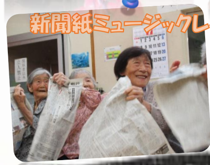
新聞紙ミュージックレク