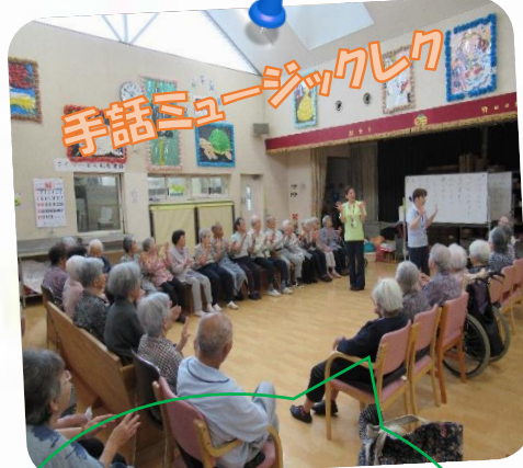
手話ミュージックレク

今年も”家族会””お楽しみ会”を開催致しました!! 出席されたご家族様、お忙しい中での出席有難うございました。 また、今回残念ながら出席出来なかったご家族様、 是非来年の参加を職員一同お持ちしております◎