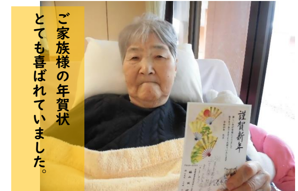
ご家族様の年賀状 とても喜ばれていました。