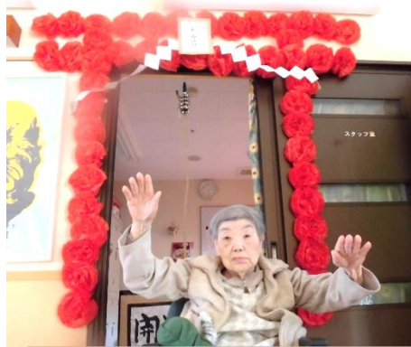
初詣は手作り野田神社！！