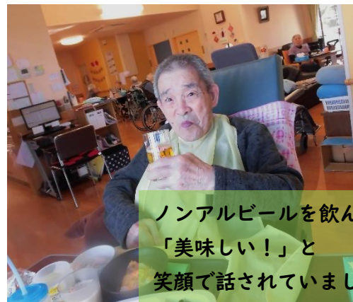
ノンアルビールを飲んで 「美味しい！」と 笑顔で話されていました