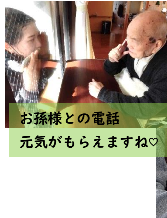
お孫様との電話 元気がもらえますね♡