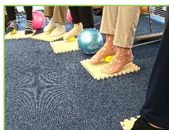
ゴルフボールで足裏を