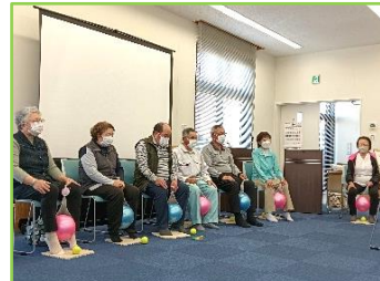
大きなボールを使って